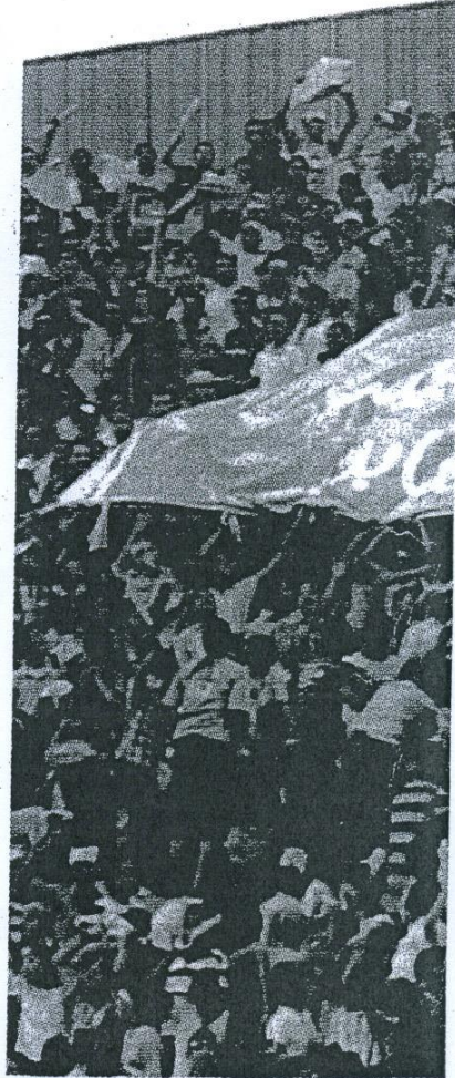
ي يتوق لرؤية فريقه الموسم المقبل بحلة جديدة